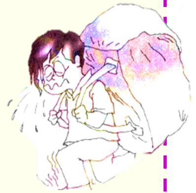
作者：徐家匯堂區---保祿·王斌

從今天起，試一試吧，把不快的“檔案資料”一一清除。你的生命一定會變得輕鬆、如意。